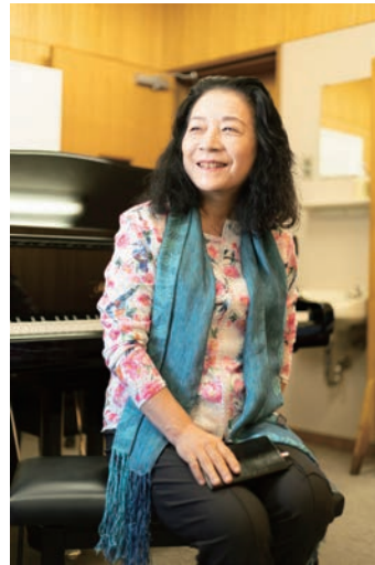
青柳いづみこ (あおやぎ・いづみこ) ピアニスト・文筆家

青柳いづみこさんプロデュースによる第49回は、気鋭の三絃奏者・本條秀慈郎さんを迎えて、高橋悠治さんが紡ぐ世界をお楽しみください。青柳さんの「高橋悠治という怪物」(河出書房新社 2018) や「音楽で生きていく！」(アルテスパブリッシング 2019) にも登場する本條さん。スリリングで深みのある音色に心がときめきます。